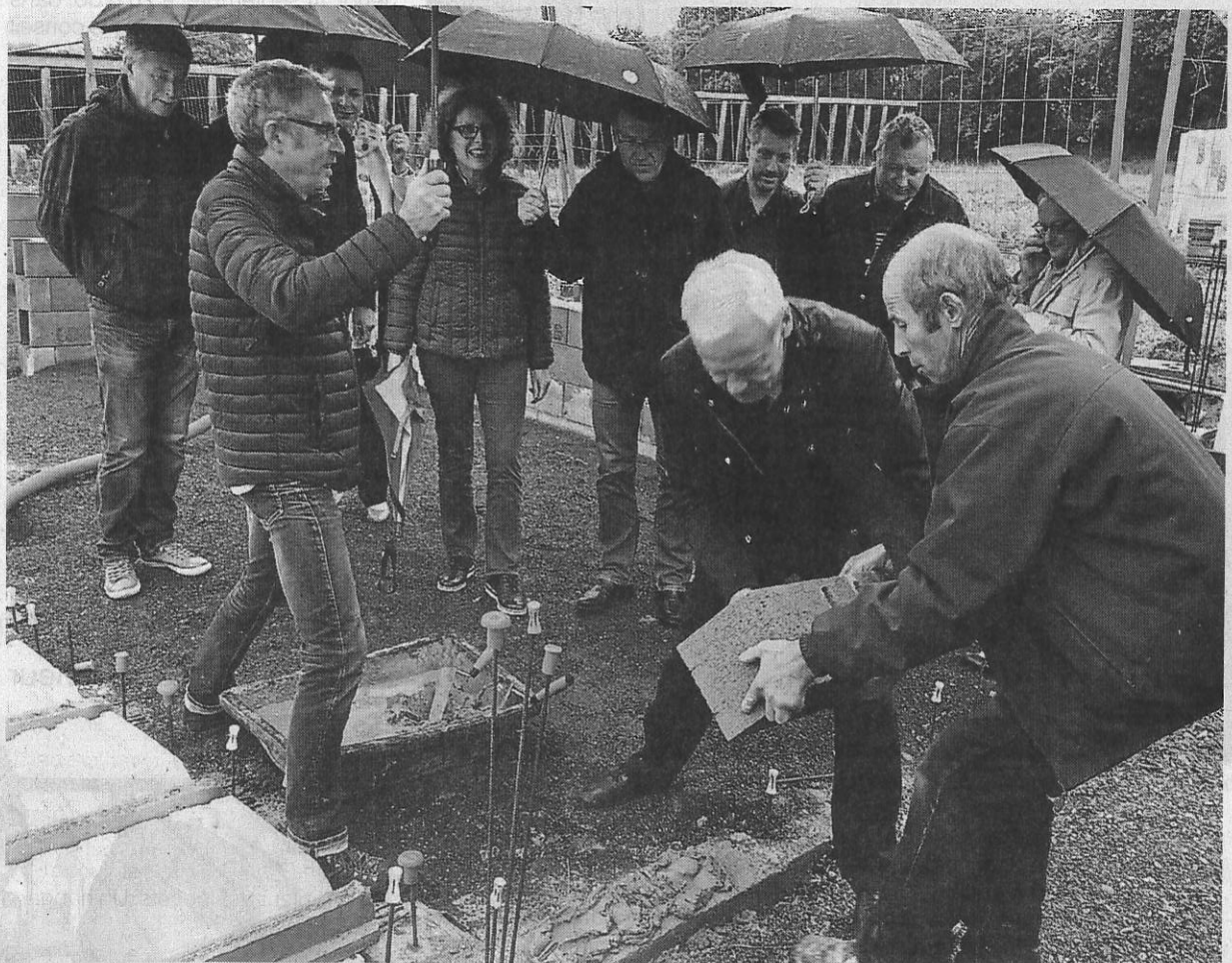
La première pierre de la nouvelle demeure dans l'éco-quartier a été posée, vendredi.

Un quatrième lot, vendu en entier, sera composé « de cinq constructions jumelées », soit dix habitations